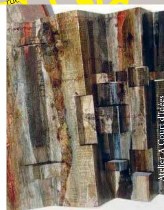
Atelier A Court d'Idées